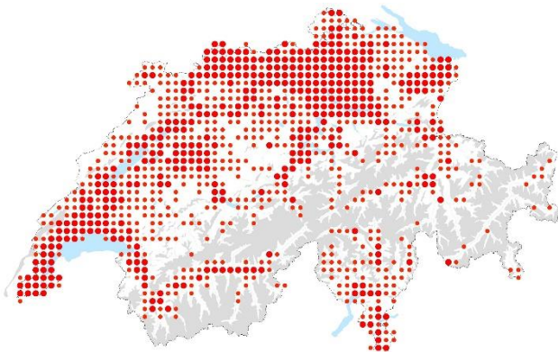
Carte de distribution Info Flora

Plante herbacée originaire d'Amérique du Nord, la vergerette a été introduite en Europe comme espèce ornementale dès le 17ème siècle. Bien qu'aujourd'hui elle ne soit plus commercialisée, elle s'est depuis longtemps naturalisée avec une préférence pour les milieux perturbés. A l'origine espèce rudérale, ses populations sont en pleine expansion dans les prés maigres dont elle menace aujourd'hui la flore indigène caractéristique.