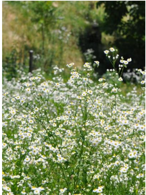
Erigeron annuus