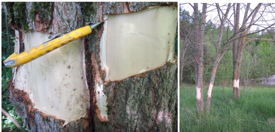
Des robiniers cerclés pour interrompre le retour des réserves dans les racines.

population (également les tiges \varnothing < 10 cm) car un échange de réserves entre les arbres est possible (croissance clonale ou concrescence de racines. Contrôler l'année qui suit la dernière intervention. Pour plus d'informations, consulter la fiche d'information Info Flora sur le cerclage.