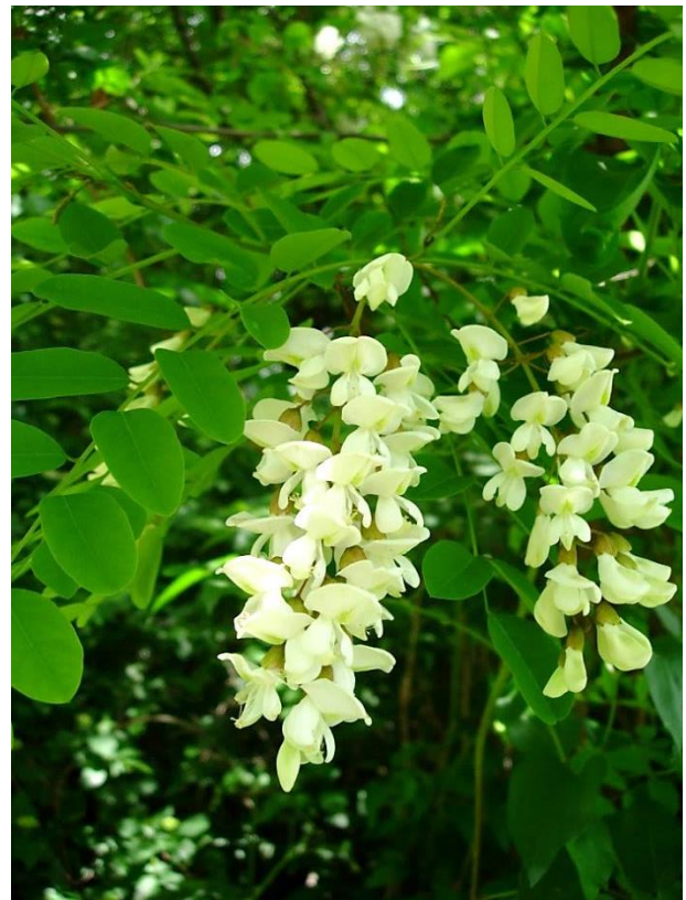
Robinia pseudoacacia