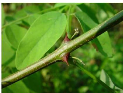
Aiguillons (=stipules des feuilles)