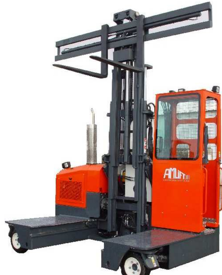
Chariot élévateur latéral