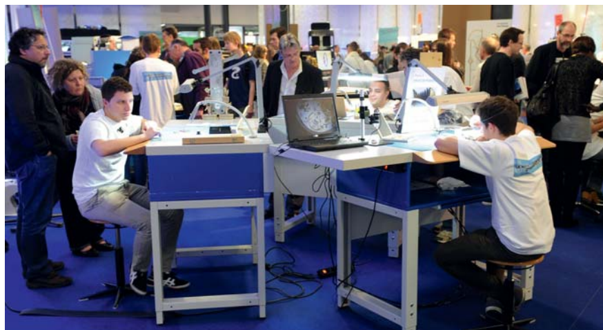
Le Secrétariat d'Etat à la formation, à la recherche et à l'innovation (SEFRI) est partenaire du Salon interjurassien de la formation 2014.

Au chapitre des événements, notons une conférence de la SUVA (invitée d'honneur)