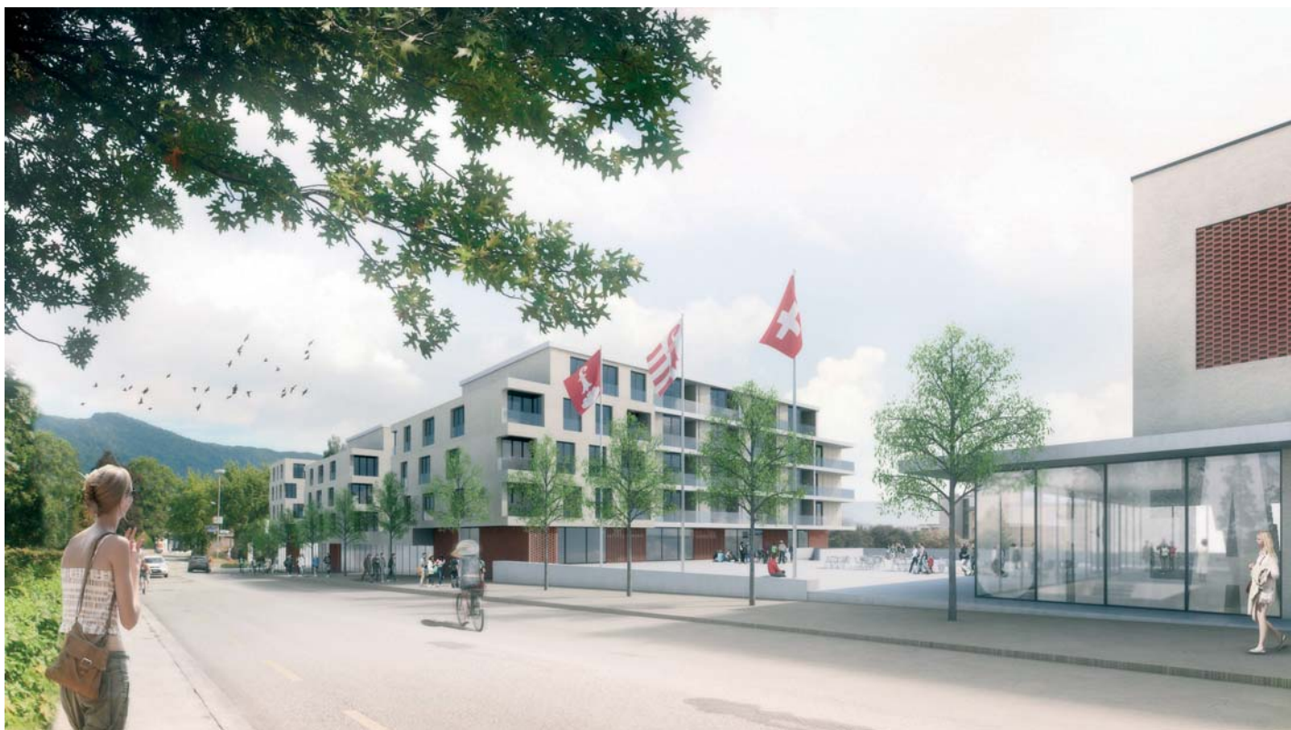
Illustrations du projet lauréat - GXM - avril 2014