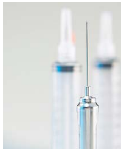
Fig. 5 Le vaccin contre la méningo-encéphalite à tiques offre une très bonne protection.