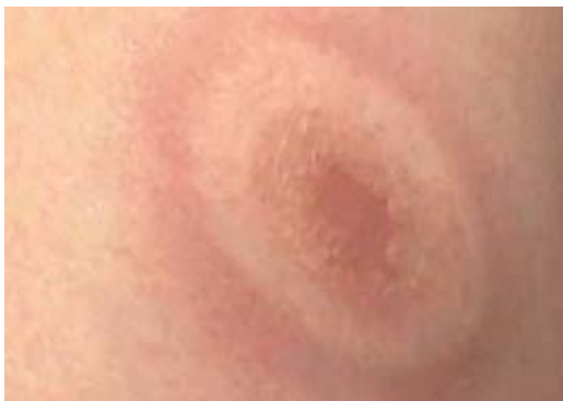
Fig. 2 Lésion typique de la peau au stade précoce de la borréliose.

Placards cutanés atrophiques et violacés. Rarement, atteintes chroniques du système nerveux ou des articulations.