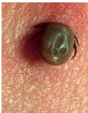
Fig. 4 Ablation de la tique: saisir la tique le plus près possible de la peau avec une pince à épiler ou une pincette spéciale et l'extraire verticalement. Désinfecter ensuite la plaie.