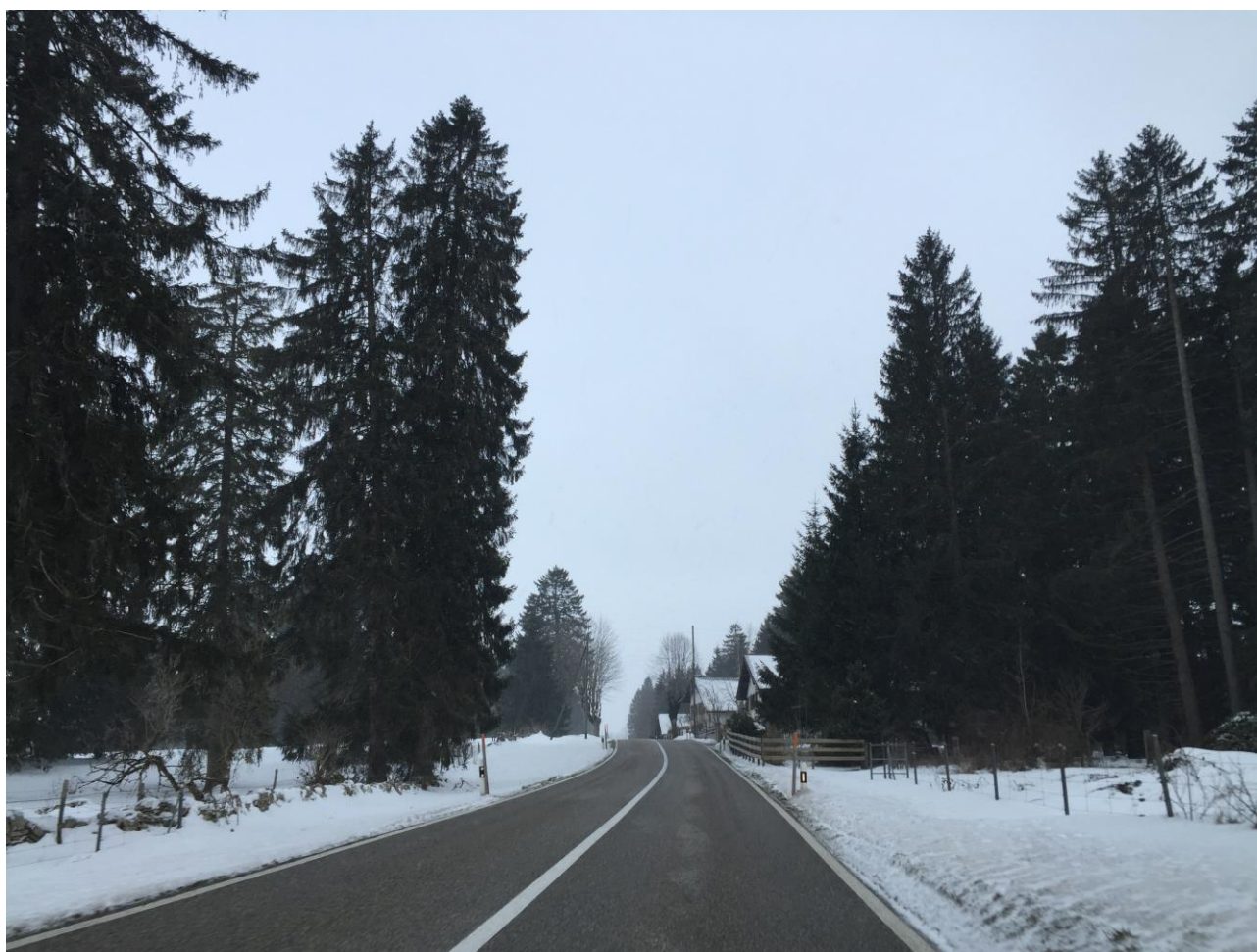
Photo secteur sur le Gez, prise en direction de la Chaux-de-Fonds