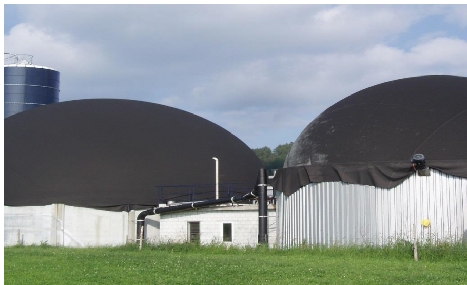
Installation de méthanisation