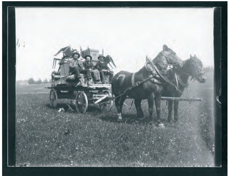
Attelage et déménagement. Fonds Eugène Cattin: ArCJ, 137 J 3085a.