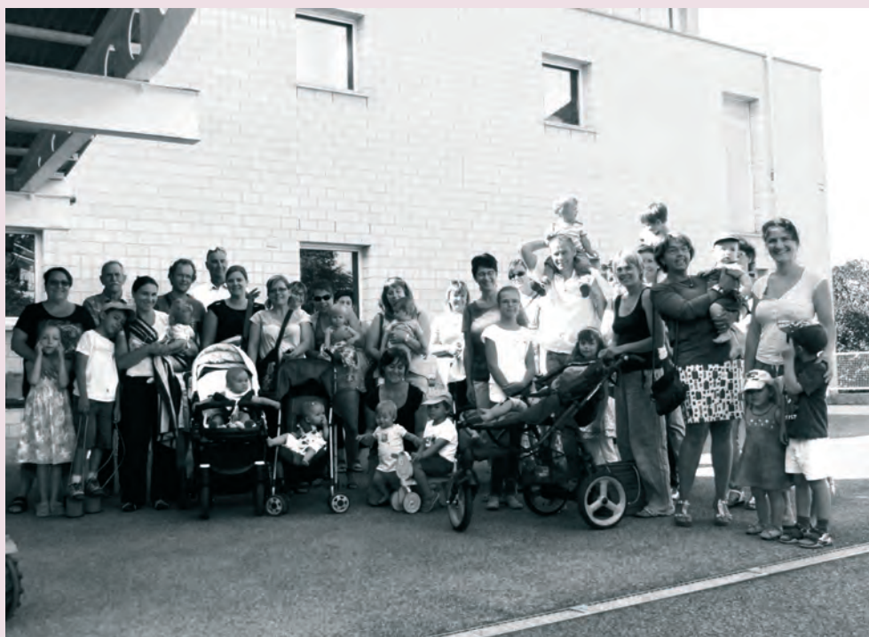
Lancement du projet Né pour lire aux Franches-Montagnes, à la Bibliothèque communale et scolaire du Noirmont.