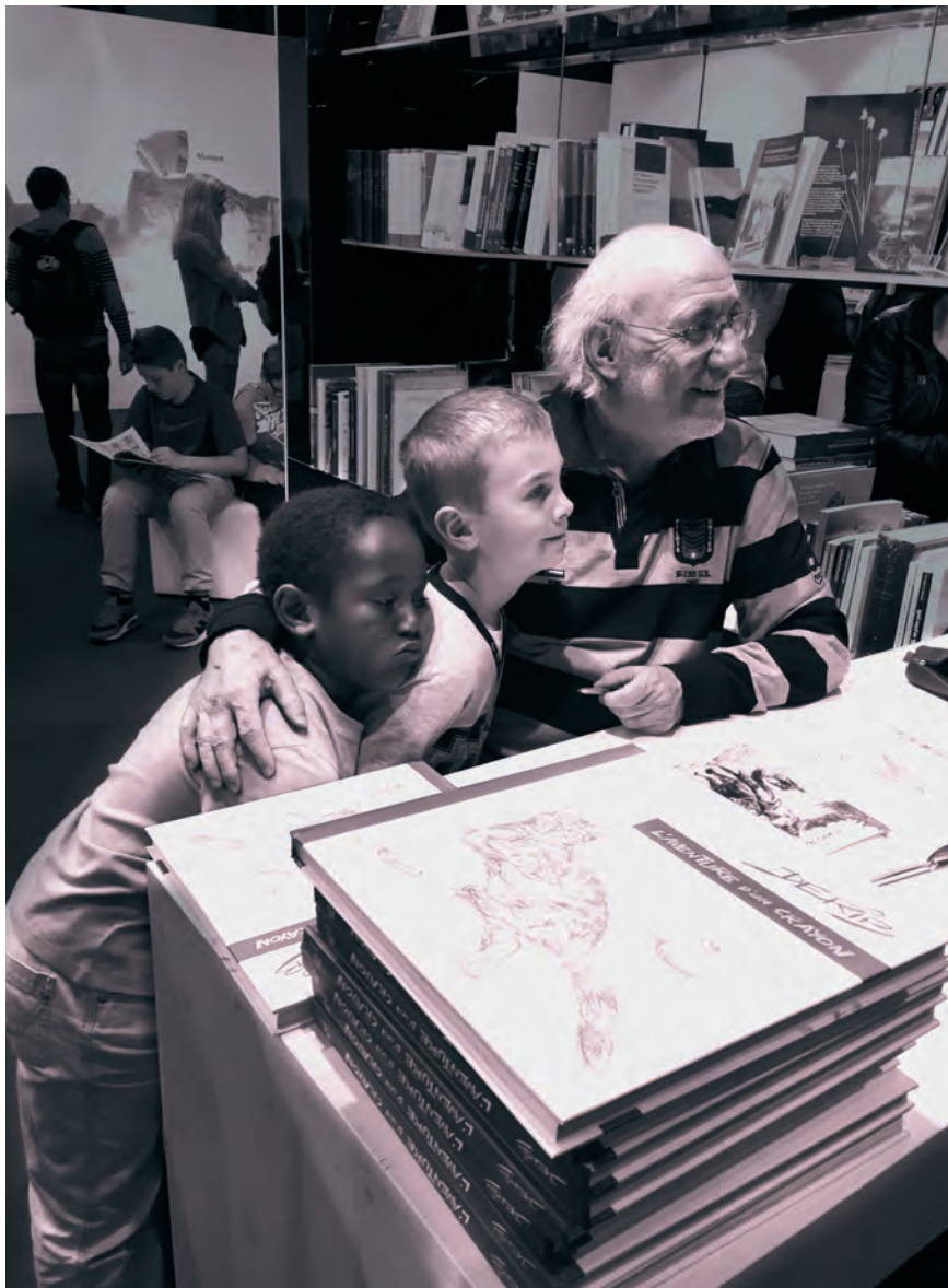
Derib en dédicace.