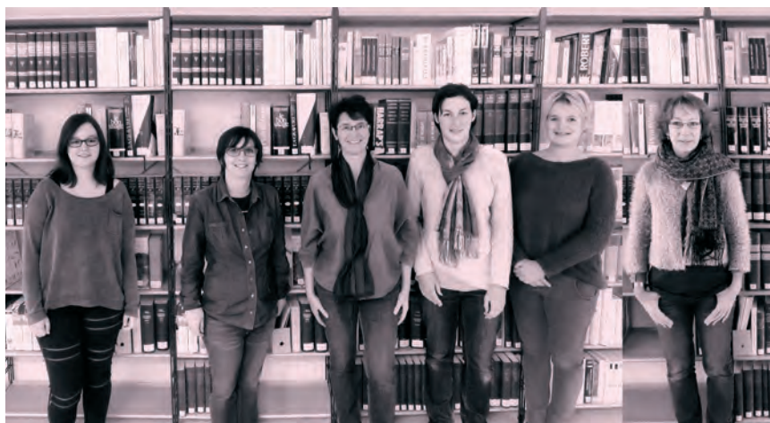
L'équipe de la Bibliothèque cantonale jurassienne.

aux Archives sonores de la RTS et de la Phonothèque nationale suisse, ainsi qu'aux Archives Web Suisse. La Bibliothèque cantonale jurassienne gère également un riche Fonds ancien, constitué d'environ 20 000 imprimés, essentiellement des XVII e et XVIII e siècles, consultables en salle de lecture.