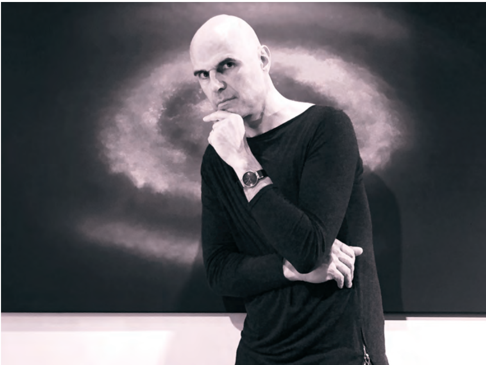
Apéritif musical avec Narcisse.