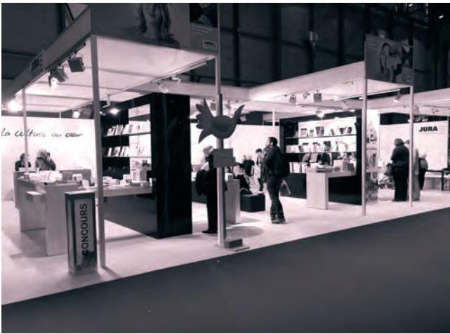
Vue du stand avec son slogan « Le Jura, la culture au cœur ».