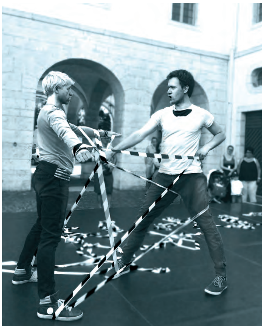
« JINX 103 », performance de la Compagnie de danse Jozsef Trefeli, cour de l'Hôtel des Halles, Porrentruy, juin 2015.

Les Affaires culturelles contribuent notamment à encourager des activités culturelles assumées par des associations, groupes ou personnes, à soutenir la création artistique, la recherche, l'animation, la formation aux métiers des arts et la promotion des activités culturelles, à mettre en œuvre une politique culturelle afin de soutenir les activités culturelles jurassiennes, et à contribuer à la diffusion du patrimoine culturel jurassien vivant et aux échanges culturels.