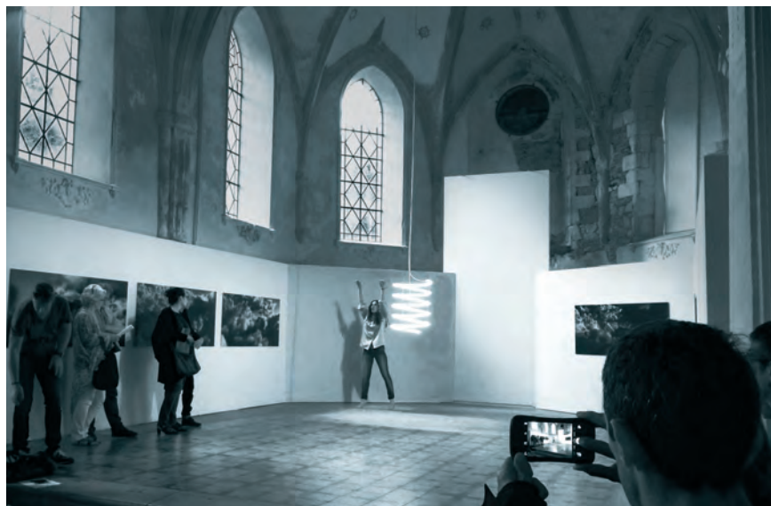
Vernissage de l'exposition L'Humén à la Nef, Le Noirmont.