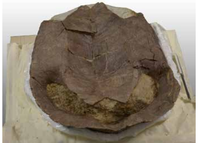
Carapace de la tortue «Thérèse» : dossier (en haut) et plastron (en bas). Echantillon POI007-13 du site de Courrendlin-Poillat.