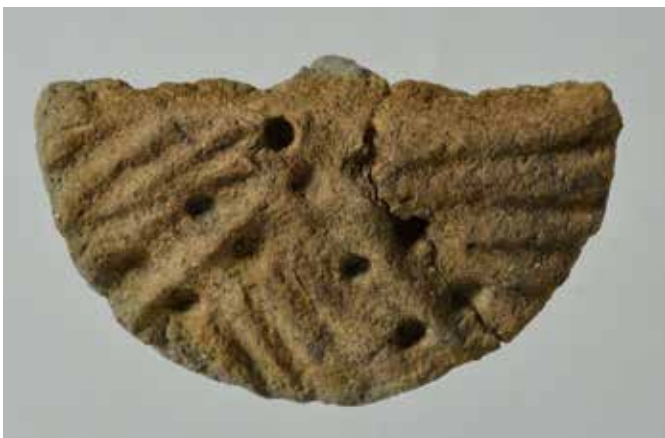
Delémont-Communance Sud. Couvercle en céramique de l'âge du Bronze final, face intérieure décorée. Diamètre 7 cm.

Publications et promotion. Les toutes dernières études liées aux découvertes réalisées sous le tracé de l'autoroute A16 se sont achevées en 2013. Il s'agissait toutefois après cela d'assurer l'édition et la publication des textes rendus. La série des Cahiers d'archéologie jurassienne a ainsi pu être complétée de deux volumes durant l'année 2014 :