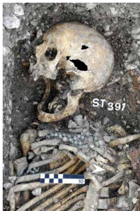
Courtételle-Saint-Maurice. Tombe 391, le défunt possédant un chapelet placé entre les mains.

mois. Durant cette année, l'intervention s'est concentrée sur les parties centrale et orientale du site et a permis de mettre au jour quelque 350 structures. Cinq petites cabanes en fosse et un foyer de forge, situés dans la partie centrale, témoignent des activités artisanales du début du Moyen Âge. C'est cependant la surface recouverte par la nécropole autour de l'ancienne église de Saint-Maurice, dans la partie orientale du site, qui a livré la plupart des structures, dont plus de deux cents sépultures. Les tombes documentées à ce jour datent majoritairement des derniers siècles d'occupation du cimetière, entre le XV e et le XVIII e siècle. Des traces de cercueils en bois cloutés sont parfois conservées, et plusieurs tombes ont livré des chapelets, des médailles et des pendentifs à symbolique chrétienne comme mobilier funéraire.