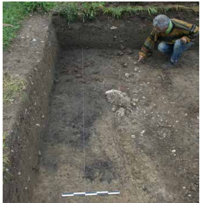
Vicques. Fosses de travail et scories de fer en cours de dégagement.

Le troisième projet concernait également une maison familiale, située quant à elle au sud de la villa gallo-romaine de Develier. Les sondages réalisés en amont des travaux de