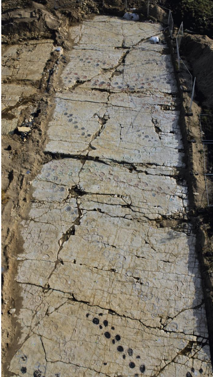
Dalle à traces de dinosaures sur le tracé de l'A16