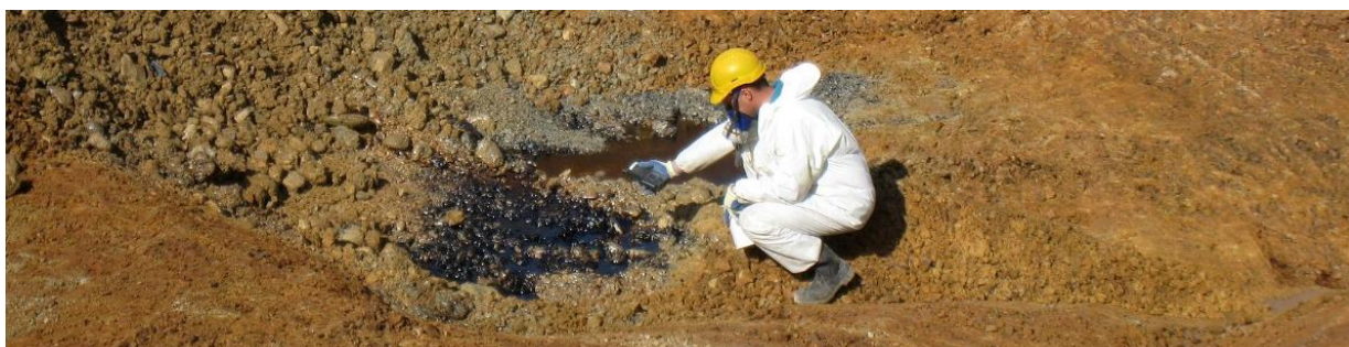
Assainissement final de l'ancienne usine à gaz de la Mandchourie à Delémont - 2012