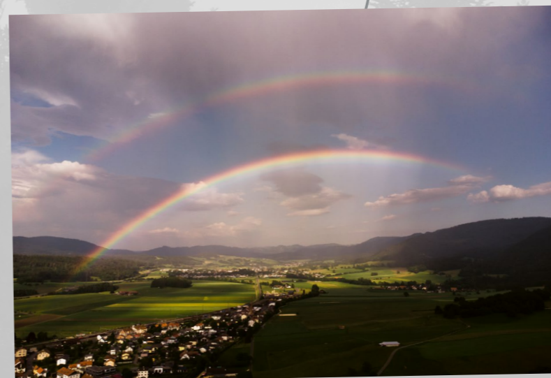
Début juin haut en couleur sur la vallée de Delémont , photographie de Loïc Seuret prise depuis la cabane forestière de la Morée à Glovelier.

Publiée sur Instagram le 25 avril 2022 par @isafun76