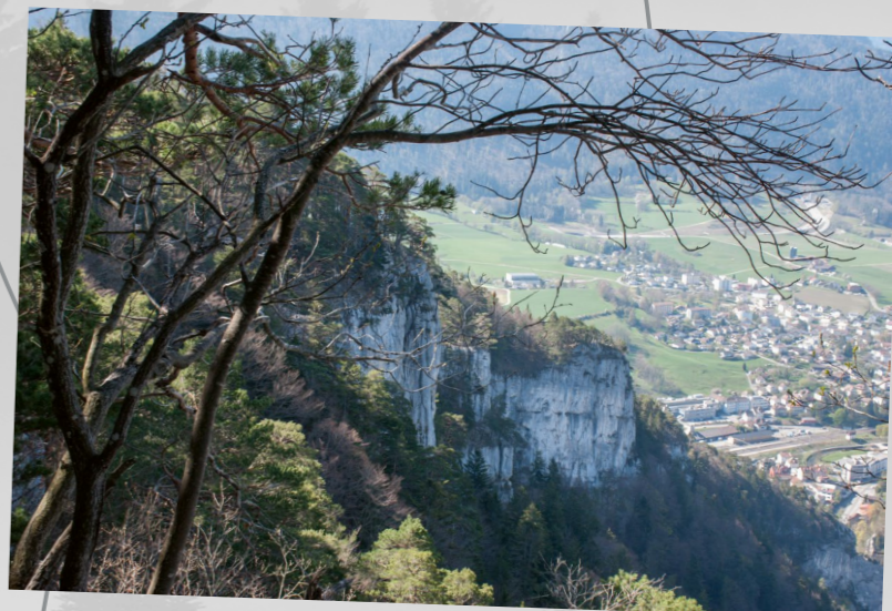
Depuis les plates-formes, photographie de Isabelle Courbat prise au sentier des plates-formes au Mont Raimeux.

Publiée sur Instagram le 25 avril 2022 par @isafun76