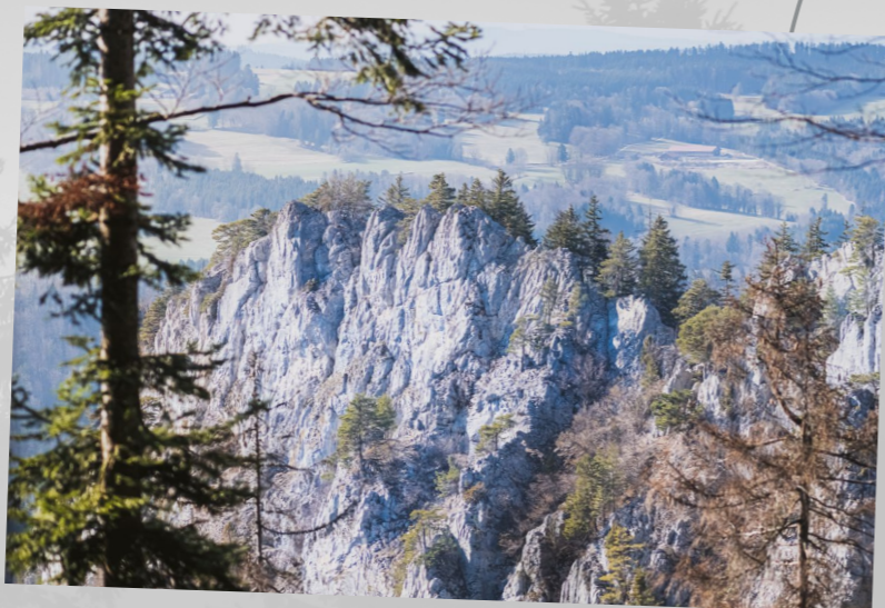
Solide comme un roc , photographie de Gaëtan Schnepf , prise au Noirmont à proximité des Sommètres.

Publiée sur Instagram le 20 juillet 2022 par @les_photos_de_gaetan