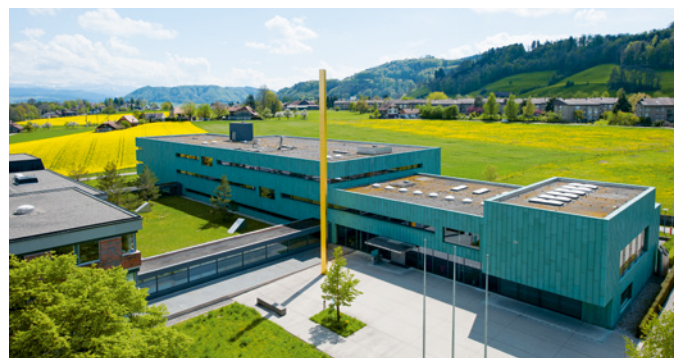
Institut fédéral de métrologie METAS Lindenweg 50, 3003 Berne-Wabern, Suisse téléphone +41 58 387 01 11, www.metas.ch

En Suisse, les offices cantonaux de vérification (services de métrologie) sont responsables de la vérification et de la surveillance des balances, pompes à carburant (essence, diesel, gaz combustible liquéfié et AdBlue) et camions-citernes, des mesures de volume et de longueur. Les vérificateurs sont à disposition pour toute question. Vous trouverez l'office de vérification compétent dans votre domaine et son adresse dans un répertoire sur le site Internet de METAS ( www.metas.ch/verifier ).