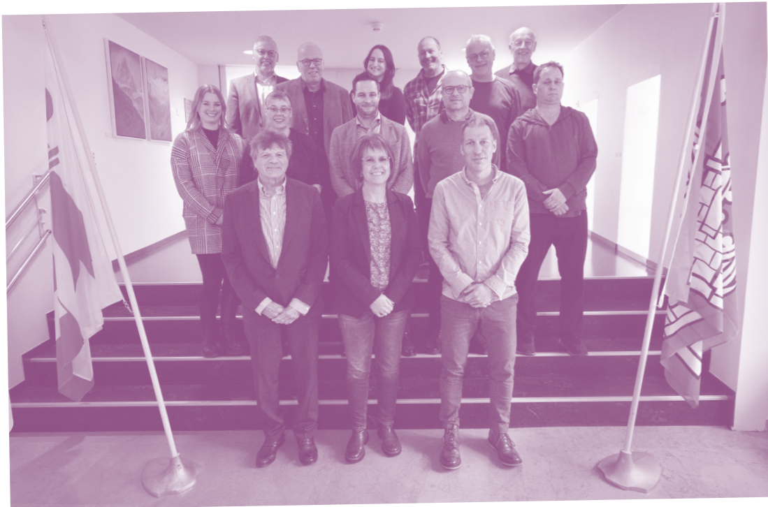
Les membres de la CSM accompagnés de la présidente de la DAJ.