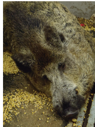
Sanglier présentant des signes de peste porcine aiguë : l'animal a une fièvre élevée et est apathique

pendant des mois dans la viande de porc ou de sanglier et dans les produits à base de viande (jambon, salami, etc.). Il est par conséquent interdit de donner des restes de repas à des porcs en Suisse et dans les pays de l'espace européen. La peste porcine peut aussi se transmettre indirectement d'une exploitation à l'autre par des visiteurs, des véhicules, des ustensiles, des vêtements, des instruments contaminés, etc.