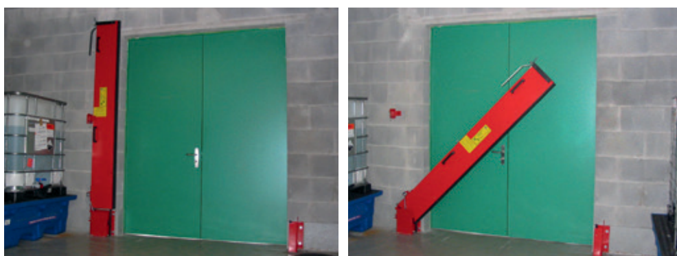
Barrière à eaux d'extinction semi-automatique