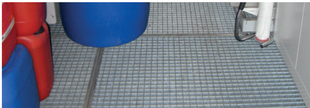
Les eaux d'extinction peuvent être retenues dans le local de stockage même, grâce au bac de rétention situé sous la grille caillebotis.