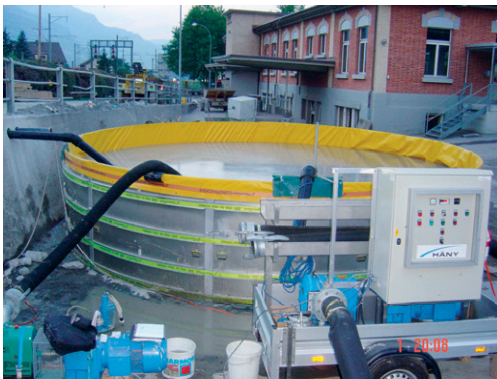
Exemple de cuve de rétention mobile