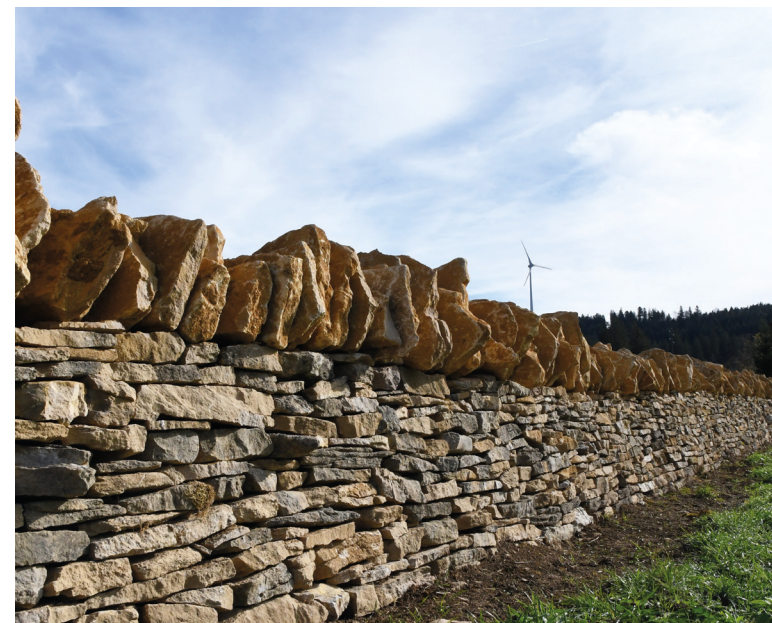
Groupe de travail interservices « Pierre sèche », avril 2018.