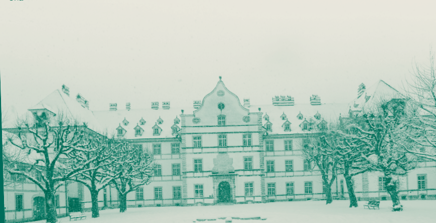
Château de Delémont