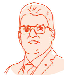
Jean-Baptiste Maître Chancelier d'Etat