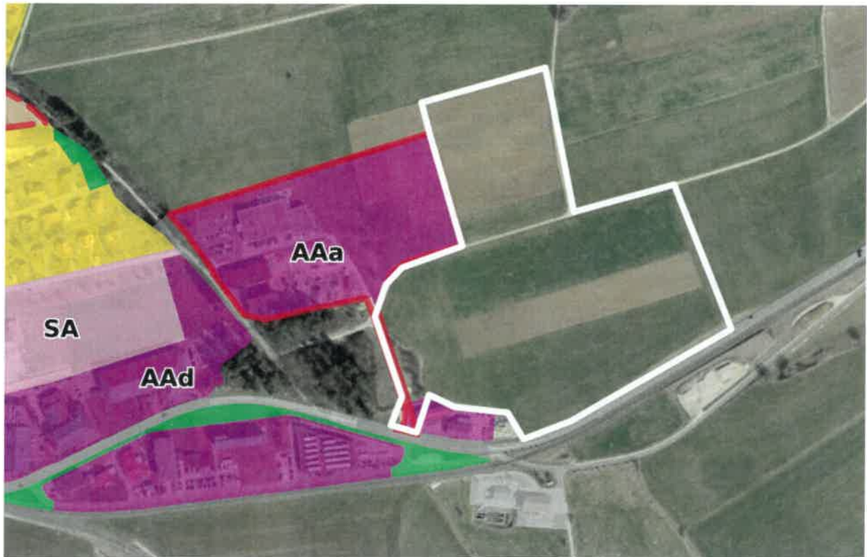
Figure 1 : Aperçu de la zone d'activités communale et du périmètre de planification (en blanc) de la zone AIC (Source : Géoportail du SIT-Jura, avec l'orthophoto 2017 et selon l'état des données à octobre 2020).

Le périmètre de planification de la zone AIC du Noirmont est contigu à la zone d'activités communale (zone AA et zone AAa avec plan spécial en vigueur) et située à proximité de plusieurs infrastructures publiques (écoles, salle de gym, etc.) et d'équipements importants tels que la centrale de chauffage à distance. Il s'étend sur une superficie d'environ 7 hectares.