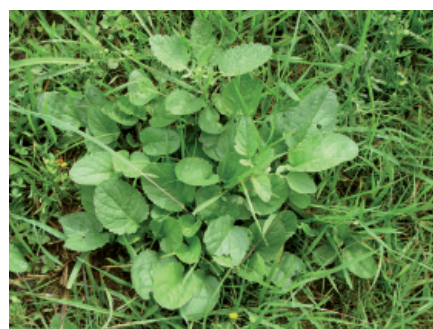
R. Gago, ART