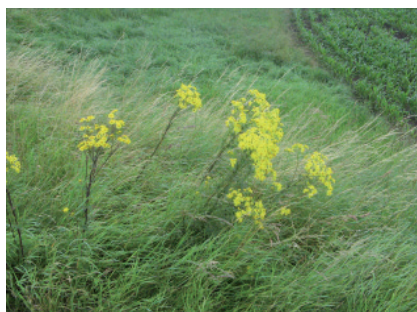
P. Aeby, IAG

Parfois aussi sur prairies ou pâturages plus intensifs, lorsque les alentours sont fortement envahis.