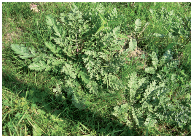
Risques d'intoxication très élevés au stade rosette, c'est-à-dire au printemps et en automne...