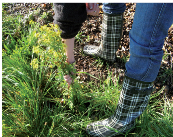
Des plantes faciles à arracher.