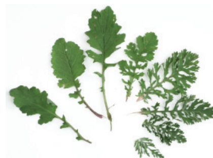
F. de rosette - F. supérieure - F. terminale avec oreillettes