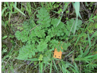
R. Gago, ART