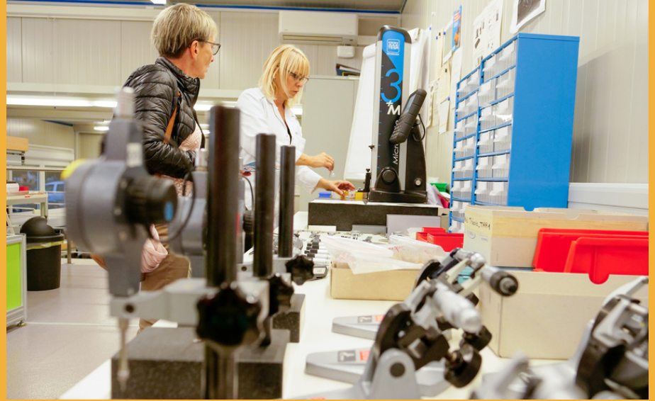
Visite du département de contrôle industriel durant les portes ouvertes de 2022.